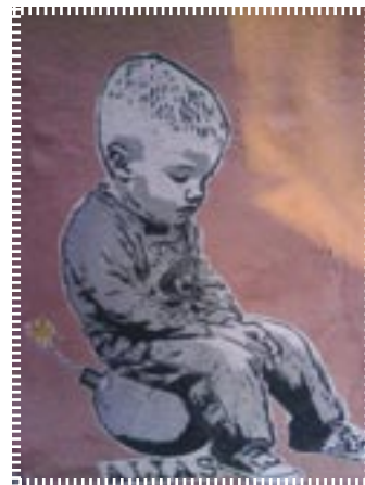
Gewalt und Krieg...