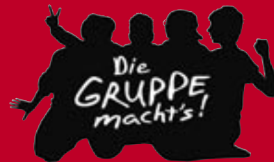
Illustration: Gerd Beck

den Blick genommen: Von der inhaltlichen Arbeit an konkreten Themen über antirassistische Jugendarbeit, Arbeit mit Schulen und SchülerInnen bis zu Fragen von Demokratie und Selbstorganisation.