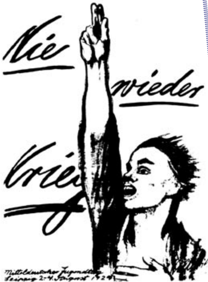
Mitteldeutscher Jugendklub Leipzig 2.-4. August 1929

In der Diskussion um Krieg und Gewalt ist es entscheidend, Frauen nicht nur als Opfer gewaltsamer Konflikte zu sehen. Sie haben als Mitglieder einer dominanten Gruppe genauso Interesse daran, → weiterlesen auf Seite 13