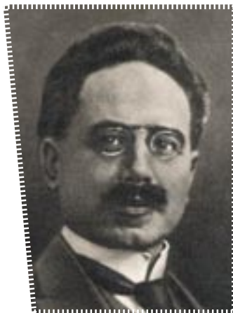
Karl Liebknecht