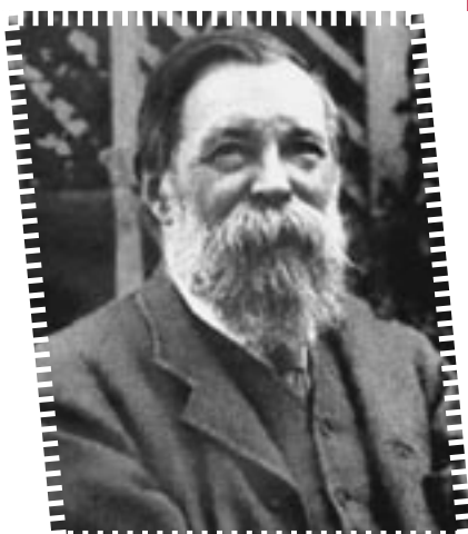
Friedrich Engels

Handel, so schreibt Engels, ist „ der Austausch der gegenseitigen Bedürfnisse, Kauf und Verkauf. Dieser Handel muß unter der Herrschaft des Eigentums, wie jede Tätigkeit,