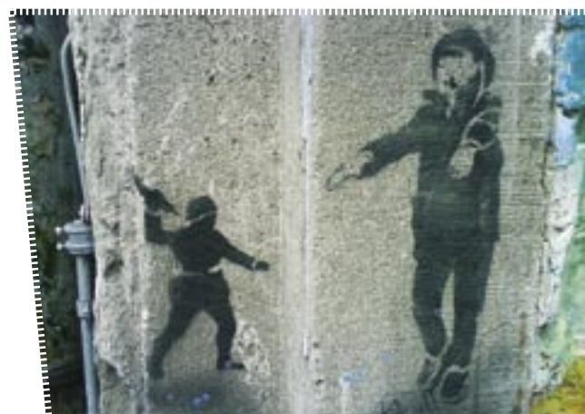
...beschäftigt auch KünstlerInnen