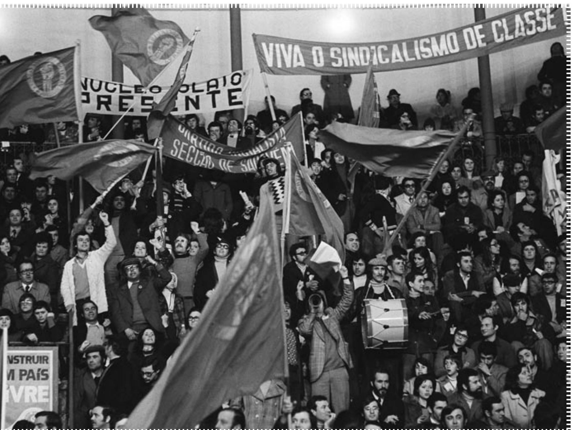
27.03.1975: Wahlveranstaltung der Sozialistischen Partei Portugals im „Campo Pequeno“ in Lissabon