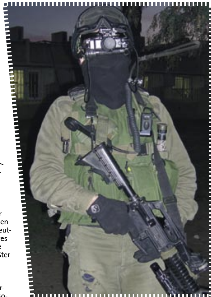
Wo steckt der Hauptfeind?

Was aber ein riesiges Problem ist, dem wir uns zu stellen haben, ist der aufkommende Nationalismus und das unkritische Unterordnen unter größere Kollektive, was bei linken Menschen nicht aufhört. Wir sind so stark im System „Nation“